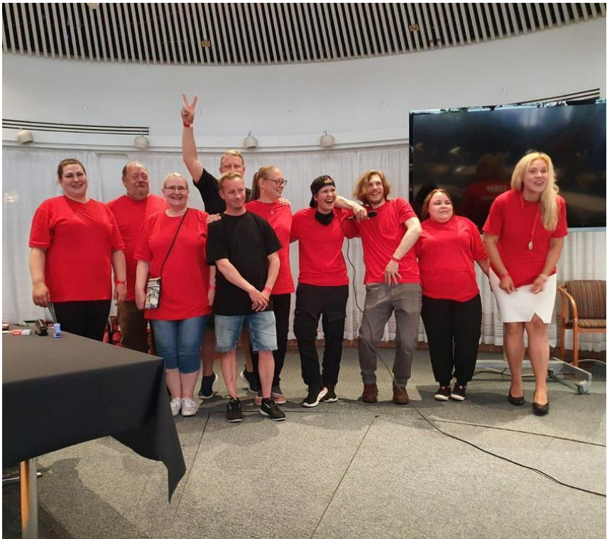
Kuvassa PAM 502 johtokunnan jäseniä